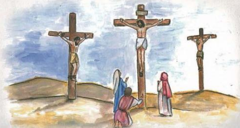
Zde dolepr správný text z přílohy 22.

KŘÍŽOVÁ CESTA JE VELKÝM VÍTĚZSTVÍM LÁSKY NAD PÝCHOU A NENÁVISTÍ