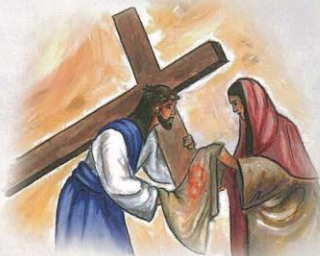
Zde dolepr správný text z přílohy 22.