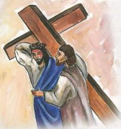
Zde dolepr správný text z přílohy 22.