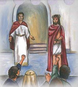
Zde dolepr správný text z přílohy 22.