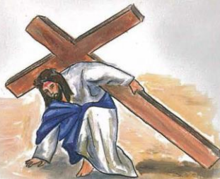
Zde dolepr správný text z přílohy 22.