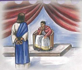
Zde dolepr správný text z přílohy 22.